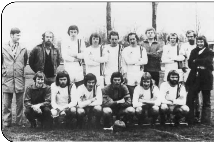
1976 Kampioen hoofdklasse G.V.B. en promotie naar de K.N.V.B.