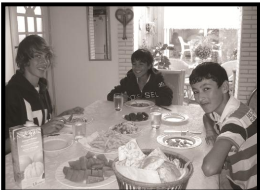
Familie Sahin: 'Twee dagen waren wel erg kort, maar toch hebben we een band kunnen opbouwen met de jongens. Het waren lieve jongens, jammer dat ze alweer weg zijn!'