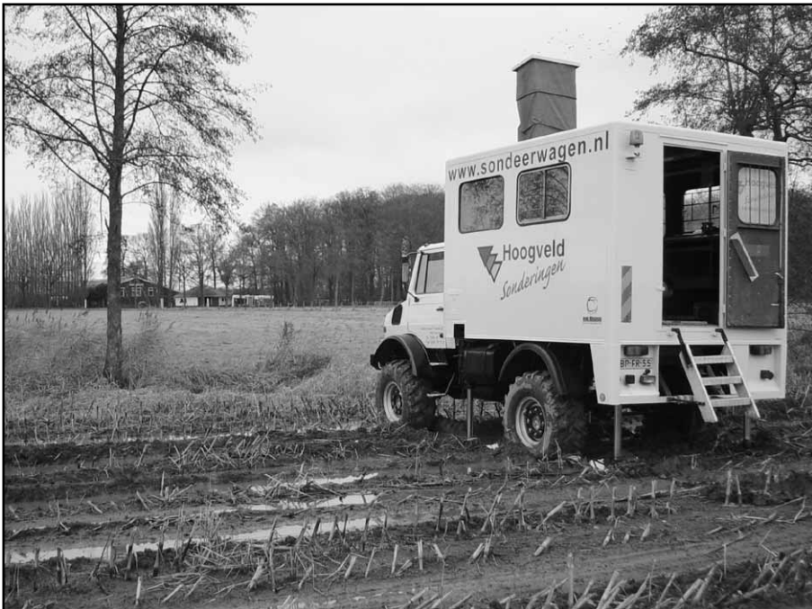
Activiteit op het nieuwe complex: een sondeerwagen meet de weerstand van de grond, op basis waarvan bepaald wordt welke fundering gebruikt moet worden.