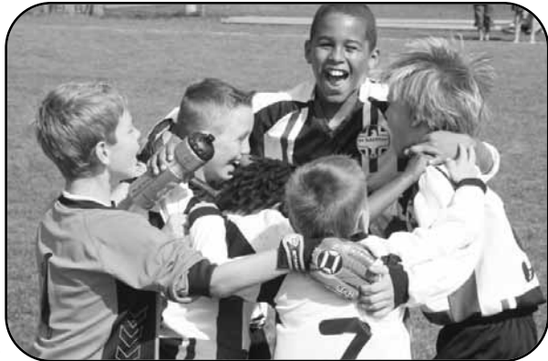
Apeldoornse Boys heeft gelijkgespeeld. Schalkhaar F1 kampioen!