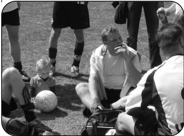
Ook een manier om te vieren dat je kampioen bent...

En hoe! Binnen een kwartier stonden we 3-0 voor. Dat kon niet meer misgaan en dat gebeurde dus ook niet. De einduitslag werd 7-2 en het was een van de beste wedstrijden van het seizoen. Na de