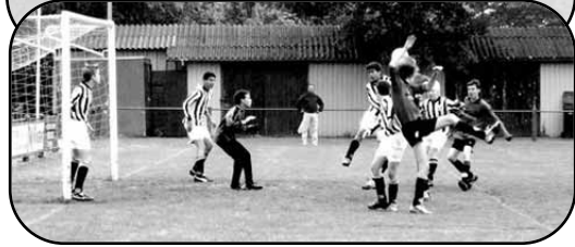
De C4 in actie tijdens de kampioenswedstrijd.