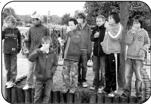
De E1, stil genietend van het zojuist behaalde kampioenschap.